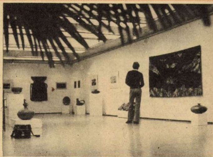
A celdömölki tárlat egyik részlete.

Az alábbi írásnak volta- képpen egy kiállítást kellene méltatni. Egy bemutatót, amely önmagában is a kérdések sorát provokálja. Am, hogy engedve a csábításnak mégis inkább tágabb körben próbálom elhelyezni a Celdömölki látottakat, annak legfőbb oka; ily módon talán sikerül a tapasztaltak érvényességi körét kiterjeszteni, az időben és térben lát- szólag egymástól távol eső, különféle, rendeltetésű tárgyak közt a kétségtelenül meglévő összefüggéseket meg- jeleníteni. Felfedvén így egy mindig, minden korban jelen- levő, búvápatakként hol itt, hol ott felszínre törő, az embert mértékül vevő, hu- mánus tárgyformáló törek- vést meglettét — végső soron — ösztönző voltát, napjaink formatervezői gyakorlatára.